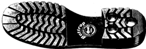
Bild 1: Sohle des Prüfschuhs (TYP "Picasso")

Die Prüfpersonen sind durch eine Sicherheitseinrichtung (Auffanggurt) gegen Sturz gesichert. Die Einrichtung behindert die Prüfpersonen beim Gehen auf dem zu prüfenden Belag nicht.