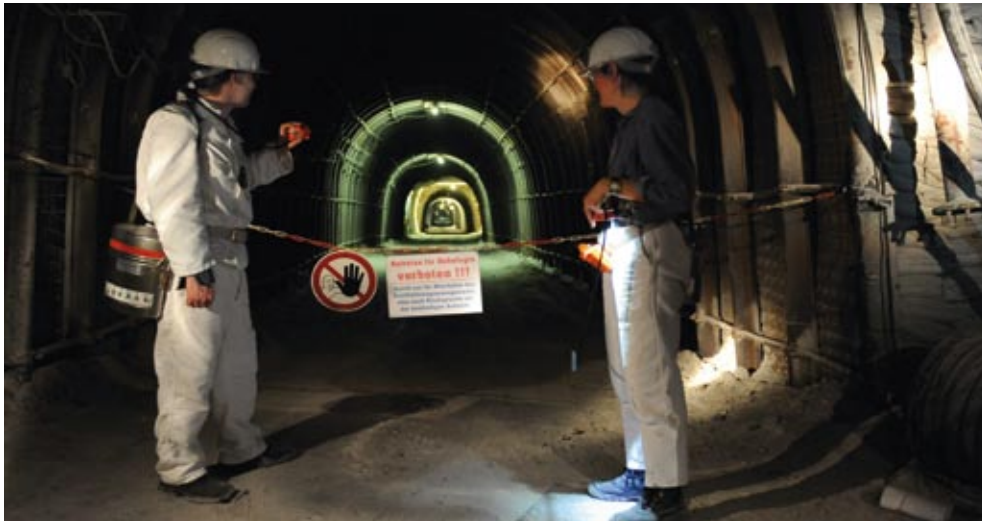
Vorsichtsmaßnahmen auf der 750-Meter-Sohle

Gesundheitsschutz und Abtransport der Salzlösungen stehen im Vordergrund