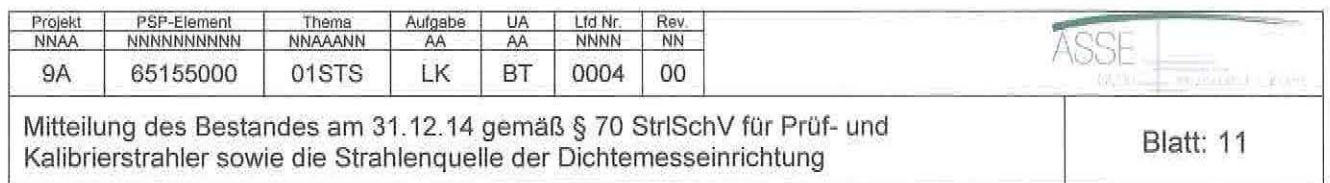
Fortsetzung Tabelle 5: Bestandsliste an radioaktiven Stoffen, Aktivität zum 31.12.14