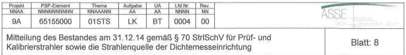
Tabelle 4: Dichtemesseinrichtung mit HRQ-Quelle der Genehmigung Nr. 07/04 vom 27.12.04, Aktivität zum 31.12.14

Die vorgenannte Genehmigung wurde mit Bescheid des Niedersächsischen Ministeriums für Umwelt und Klimaschutz vom 22.12.2008, Az. 43-40326/08/12, auf das Bundesamt für Strahlenschutz, Willy-Brandt-Straße 5, 38226 Salzgitter übertragen.