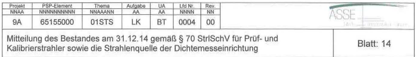
Fortsetzung Tabelle 5: Bestandsliste an radioaktiven Stoffen, Aktivität zum 31.12.14