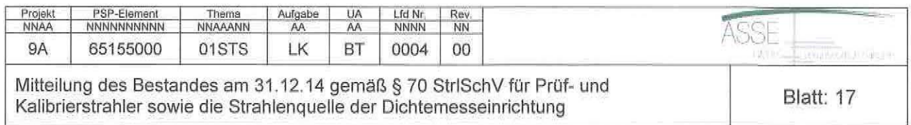
Fortsetzung Tabelle 5: Bestandsliste an radioaktiven Stoffen, Aktivität zum 31.12.14