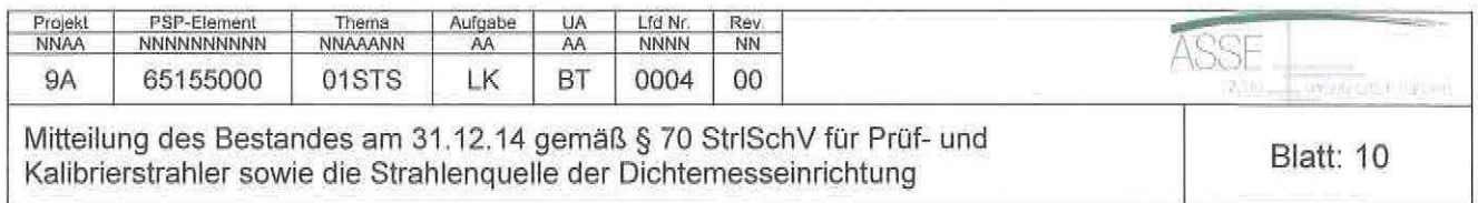
Fortsetzung Tabelle 5: Bestandsliste an radioaktiven Stoffen, Aktivität zum 31.12.14