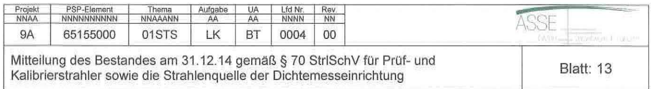
Fortsetzung Tabelle 5: Bestandsliste an radioaktiven Stoffen, Aktivität zum 31.12.14