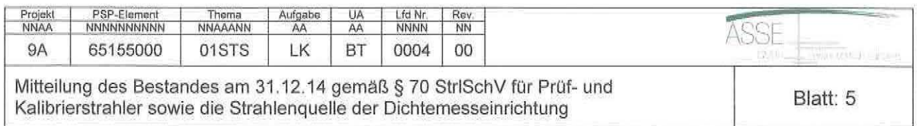
Tabelle 1: Umschlossene Prüf- und Kalibrierstrahler der Genehmigung 2/2011 vom 20.09.11, Aktivität zum 31.12.14