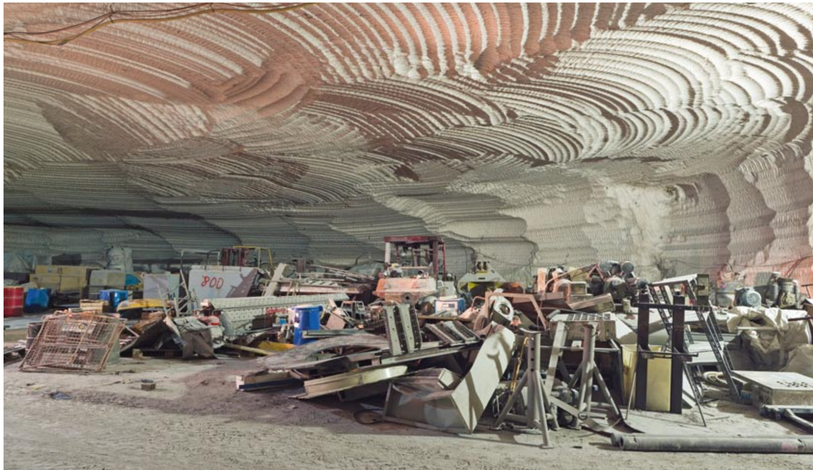
STUMME ZEUGEN IN DER UNTERWELT: IN ALL DEN JAHREN SAMMELTEN SICH VIELE GERÄTSCHAFTEN IM BERGWERK AN