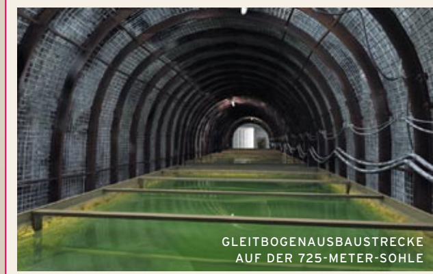
GLEITBOGENAUSBAUSTRECKE AUF DER 725-METER-SOHE

Ist das Auffangen der Zutrittswässer in 658 Metern Tiefe nicht mehr oder nur noch teilweise möglich, könnten diese bis zu den radioaktiven Abfällen vordringen. Derzeit werden auf der 725-Meter-Sohle in der sogenannten „Gleitbogenausbaustrecke“ und auf der 750-Meter-Sohle östlich der Abbaukammer 9 etwa 1,5 Kubikmeter Zutrittswässer täglich aufgefangen. Diese hatten noch keinen direkten Kontakt mit den radioaktiven Abfällen und könnten gemäß Strahlenschutzverordnung freigegeben werden. Die Lösungen erfüllen aber nicht die strengen Vorgaben der Selbstverpflichtung des BFS von maximal 40 Becquerel Tritium pro Liter. Sie werden deshalb im Bergwerk zur Herstellung von Sorelbeton verwendet, mit dem Hohlräume gefüllt und so stabilisiert werden.