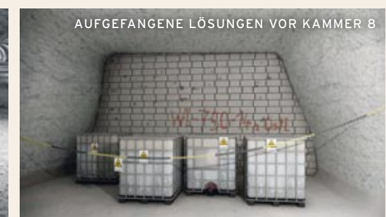
AUFGEFANGENE LÖSUNGEN VOR KAMMER 8