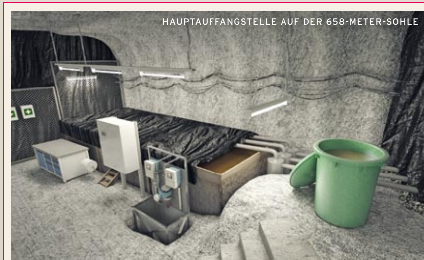
HAUPTAUFANGSTELLE AUF DER 658-METER-SOHE

In der Probe-phase sollen die bestehenden Unsicherheiten bei der Rückholung geklärt werden. Hierzu wurden die Einlagerungskammern 7 und 12 ausgesucht. Die Probe-phase besteht aus drei Schritten: dem Anbohren der Einlagerungskammern, dem Öffnen und dem probeweisen Bergen von Abfällen. Für den ersten Schritt der Probe-phase liegt bereits die Genehmigung vor. Begonnen wird mit dem Anbohren der Einlagerungskammer 7. Derzeit werden die Anforderungen aus der atomrechtlichen Genehmigung abgearbeitet. Der Arbeitsbereich vor Einlagerungskammer 7 ist bereits vollständig eingerichtet.