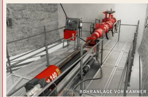
BOHRANLAGE VOR KAMMER 7

Um die Unsicherheiten und Wissenslücken für die geplante Rückholung zu beseitigen, wird in den Einlagerungskammern 7 und 12 eine Probe-phase durchgeführt. Die Umsetzung der Genehmigungsanforderungen benötigt deutlich mehr Zeit als ursprünglich angenommen. Dadurch sowie durch technische Schwierigkeiten hat sich der Termin für die erste Bohrung in die Einlagerungskammer 7 um mehr als ein Jahr verzögert. Sowohl die Probe-phase als auch die geplante Rückholung werden nach den bisher gewonnenen Erfahrungen deutlich länger dauern, als bisher angenommen.