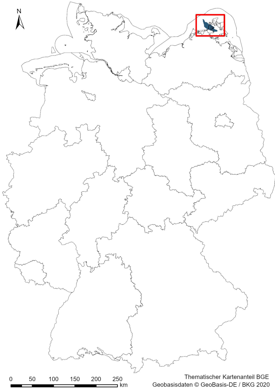
Abbildung 1: Karte der Bundesrepublik Deutschland. Hervorgehoben ist die Lage des Teilgebiets Rügen (078_08TG_197_08IG_S_f_z)