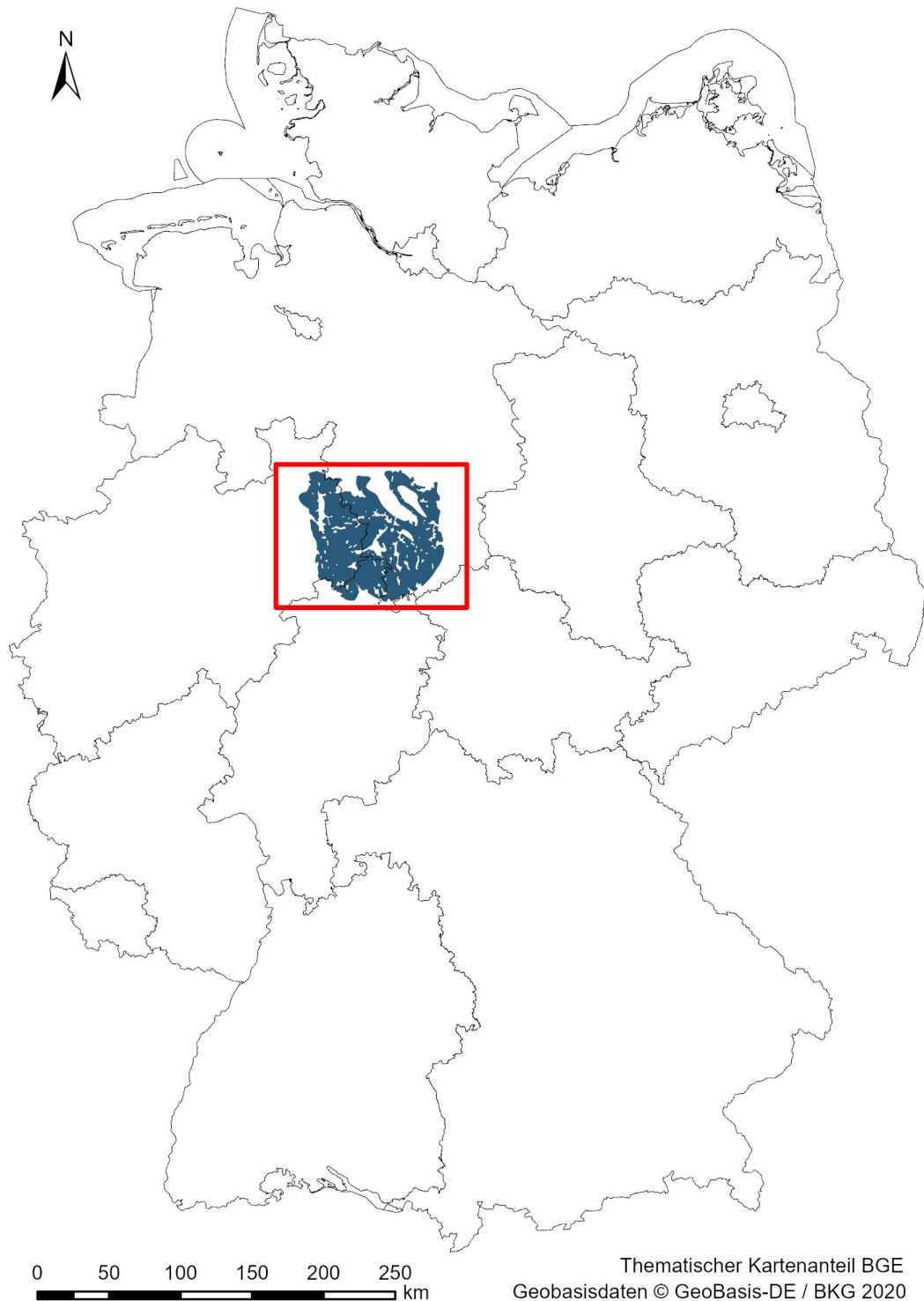
Abbildung 1: Karte der Bundesrepublik Deutschland. Hervorgehoben ist die Lage des Teilgebiets Solling-Becken (078_04TG_197_04IG_S_f_z)