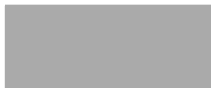
Abteilungsleiterin Vorhabensmanagement Standortauswahl