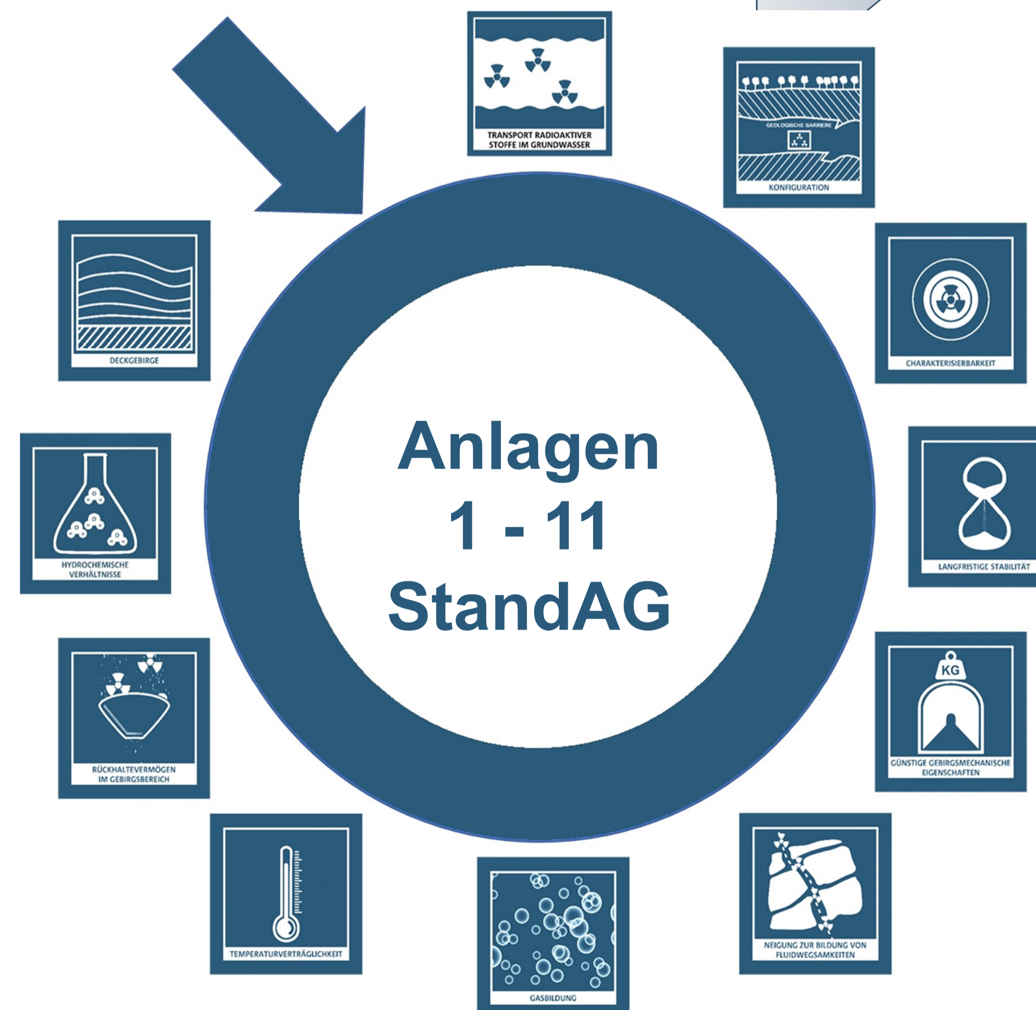
Abb. 1. Anlagen gemäß § 24 StandAG.